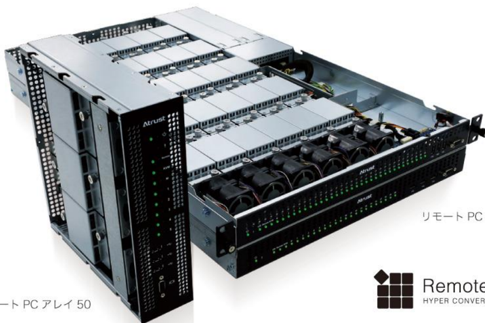
リモート PC アレイ 50